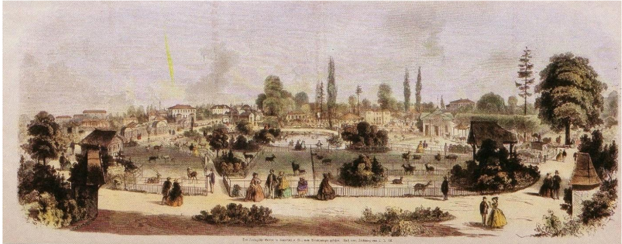
Der erste Frankfurter Zoo – 1858 noch im Westen der Stadt, vor dem Bockenheimer Tor gelegen.