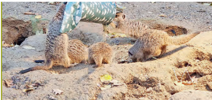
Die Erdmännchen müssen sich ein bisschen anstrengen, um an ihr Futter zu gelangen – auch dank der Mitarbeit der sogenannten Zoolotsen.